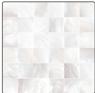
Size: 170mm x 170mm Material: PC/ABS